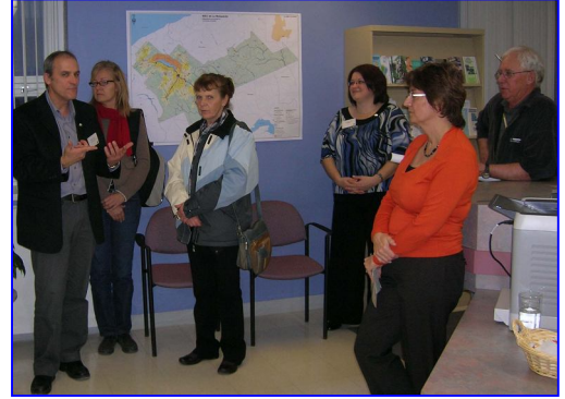
Une soixantaine de personnes prenaient part à la journée portes ouvertes.

La MRC offre des services en aménagement et en urbanisme, en évaluation foncière, en génie municipal, en foresterie, en sécurité civile et incendie et en culture et patrimoine. Elle agit aussi à titre de municipalité en ce qui concerne la gestion des territoires non-organisés.