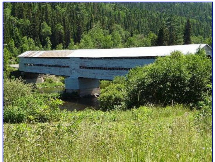
Le pont couvert de Routhierville

Rappelons que c'est à l'hiver 2004 que le Comité de survie du pont de Routhierville a élaboré, de concert avec la MRC de La Matapédia, une demande au ministère de la Culture, des Communications et de la Condition féminine (MCCCFQ) afin de